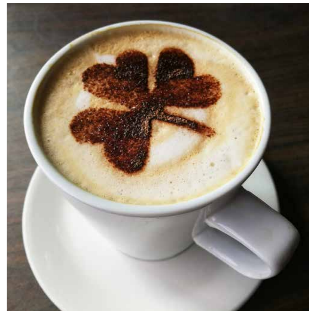
1. Shamrock er Irlands nasjonalsymbol, opprinnelig brukt av den irske nasjonalhelgenen Saint Patrick for å illustrere treenigheten.

Det er ikke bare Nordvestlandet i Norge som kan skryte av en atlantehavsvei. Det irske folket er stolt av sin Wild Atlantic Way, antagelig verdens lengste sammenhengende oppmerkede turistrute, som snirkler seg langs Irlands vestkyst i 2600 kilometer. Irland er som skapt for eventyrlystne. Hadde jeg hatt bare én ferietur igjen i livet, ville jeg sannsynligvis havnet her.