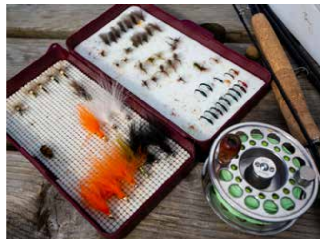
1. Turister fra hele verden fisker villørret i Irlands elver og innsjøer ('loughs').

Når vi kommer til Derry ('Londonderry' i følge britene), starter den offisielle Wild Atlantic Way-ruten. Du kan følge den veien helt til Cork i sørvest. Fra Derry kjører vi først mot nordvest. Man tenker