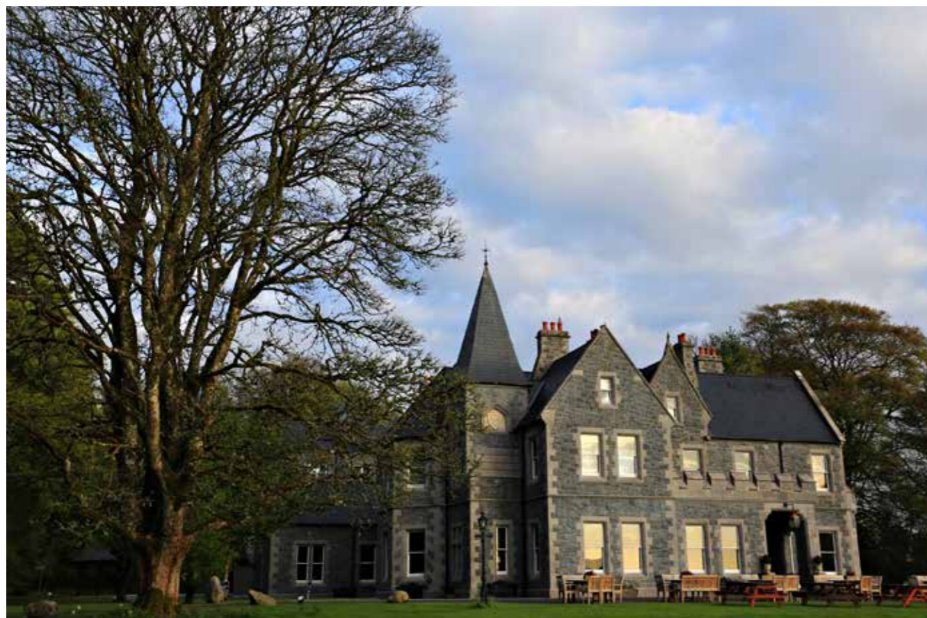
1. Mount Falcon Estate ved Ballina er et herskaps hus opprinnelig bygget i 1872 som en kjærlighetserklæring. Eierne i dag har restaurert og oppgradert bygget siden 2002.