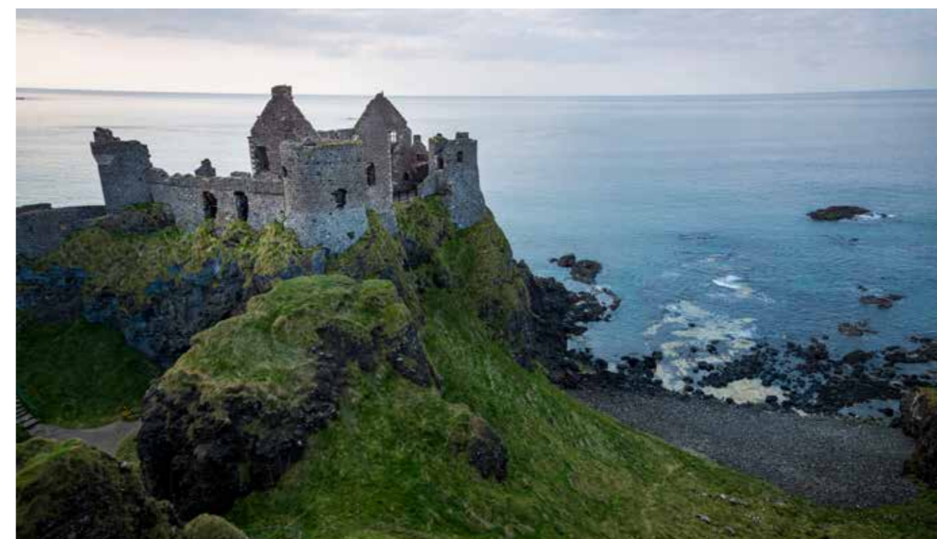
1. Det fins 30.000 slott og slottsruiner i Irland. Dunluce Castle i County Antrim ble reist på 1500-tallet.